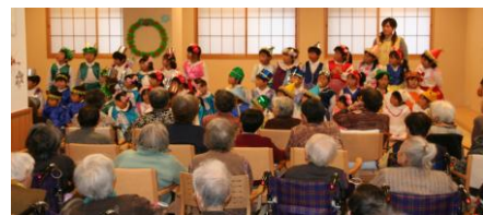
一生懸命なお遊戯に一同感心しました。