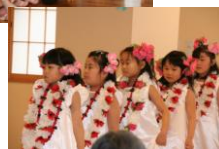
☆可愛いフラダンス と素敵な踊り☆