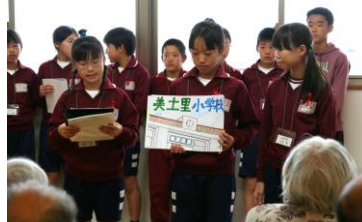
小学生と楽しい1日でした。