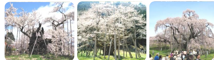
写真：【日本三大桜】 山高神代桜、根尾谷淡墨桜、三香滝桜

春の訪れと共に咲く桜。分類としては、山桜、大島桜、江戸彼岸桜など5~7種類ほどが認められており、これらの変種や交雑などから数十種類の自生種が存在します。日本では固有種・交配種を含め600種以上の品種が確認され、日本の70%はソメイヨシノだと言われています。桜は日本において最も馴染み深く、俗に国花の一つとされ警察、自衛隊などの紋章や硬貨のデザインとしても使用されています。人々の成長と共に花を咲かせ、人生の転機を彩る花とされ、最も愛されている花と言われています。