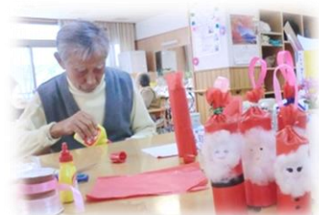
・サンタクロース飾り

今月はトイレットペーパーの芯を利用してサンタクロースの飾りを作成して頂きました。色折り紙や綿を使用し個性溢れる素敵なサンタさんが出来上がり「家族に見せるのが楽しみ♪」と喜ばれていました。