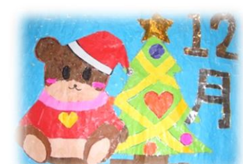
・12月カレンダー(クリスマスツリー)