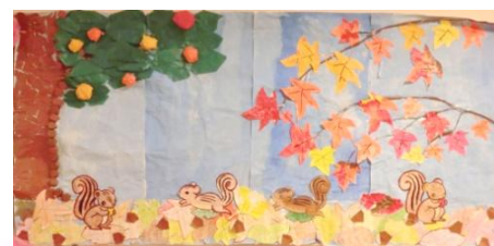
・リス達の冬支度

テイルーム手作りカレンダーの11月の貼り絵は七五三をテーマに男の子と女の子が可愛らしい衣装を身に纏った絵となりました。「孫の七五三可愛かったなあ」など思い出話に花を咲かせながら作られていました。